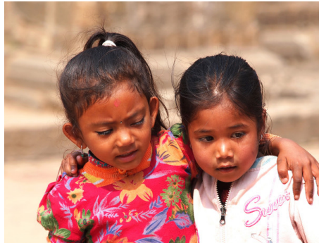
7 consejos para realizar turismo o voluntariado ético en países en vías de desarrollo