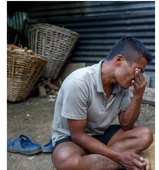
Nepal al borde de un humanitaric