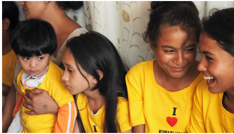
Kumari House, la casa de las princesas a Kathmandú